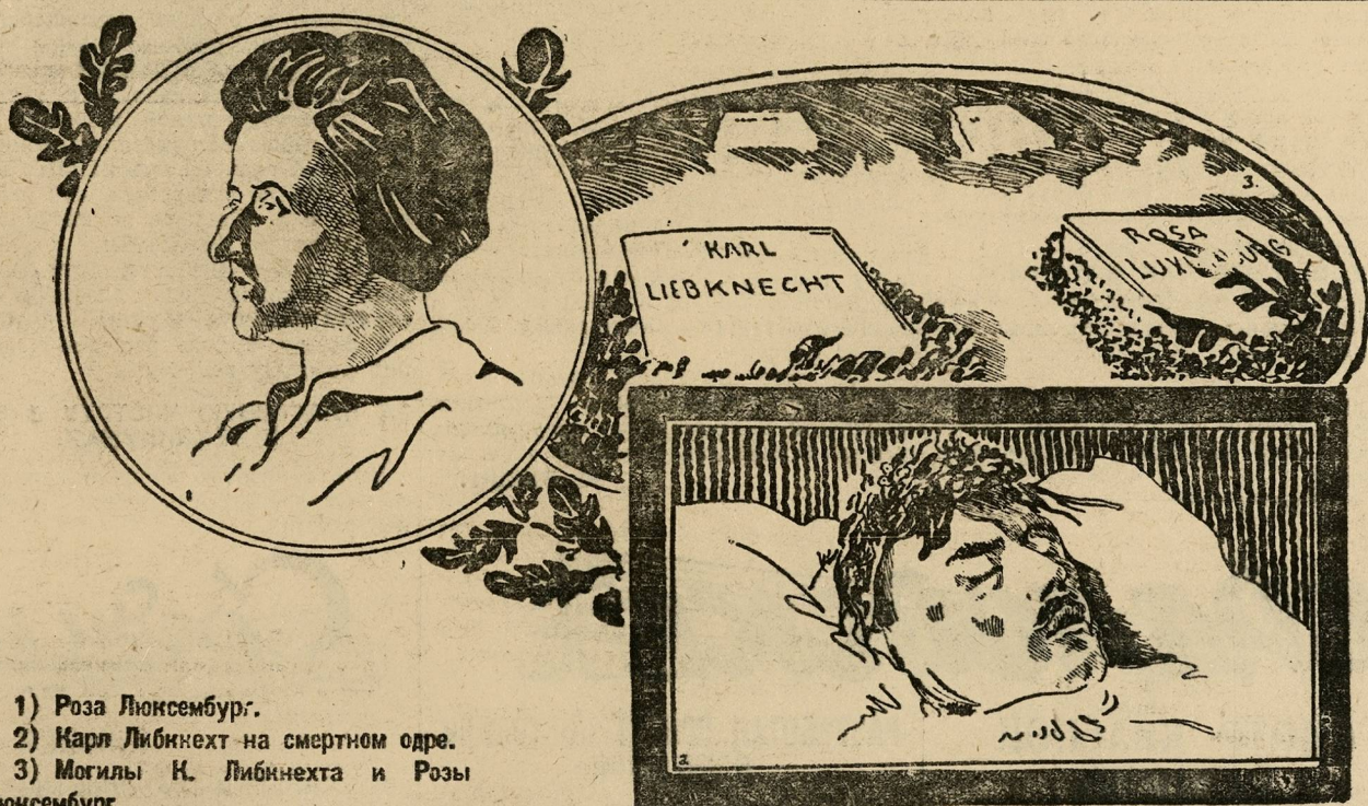
1) Роза Люксембург. 2) Карл Либкнехт на смертном одре. 3) Могила К. Либкнехта и Розы Люксембург.

Карла Либкнехта и Розы Люксембург уже нет, но брошенные ими семена дали тысячи побегов; к ним применимы слова, сказанные когда-то Карлом Либкнехтом о революционном юношеском движении: «Они были самым ярким и чистым пламенем пролетарской революции».