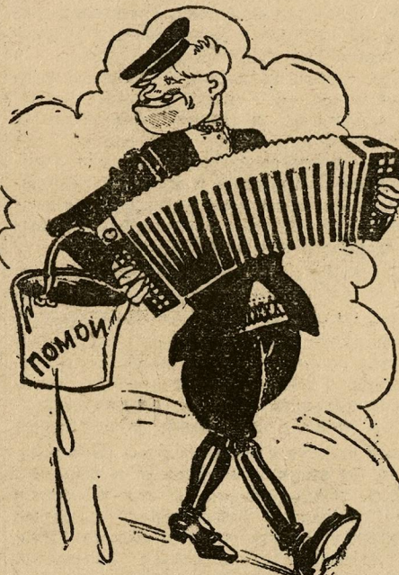
Ухарь-купец на «Огнеупоре».