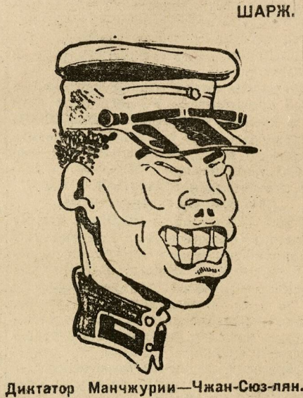
Диктатор Манчжурии — Чжан Сюэ-лянь.

Великий настоящий «ревизор» — Октябрьский шквал — заглянул в многочисленные богоугодные заведения, вывел