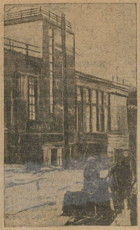
Новый клуб союза пищевинов в Свердловске.