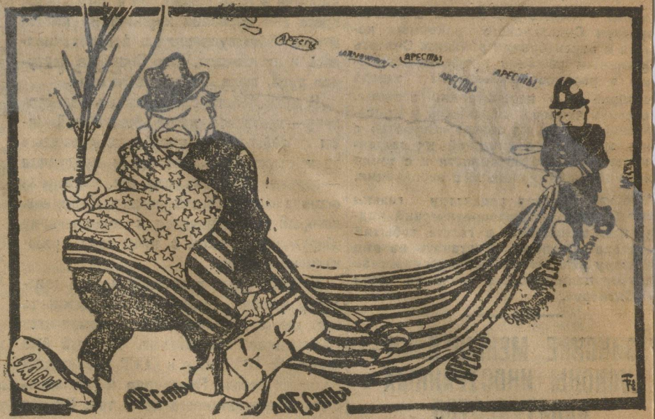
... и кровавых последствий.

Пребыванию Гувера, избранного президентом С.-А. С. Ш., в Аргентине ознаменовалось многочисленными арестами и столкновениями революционеров с полицией.