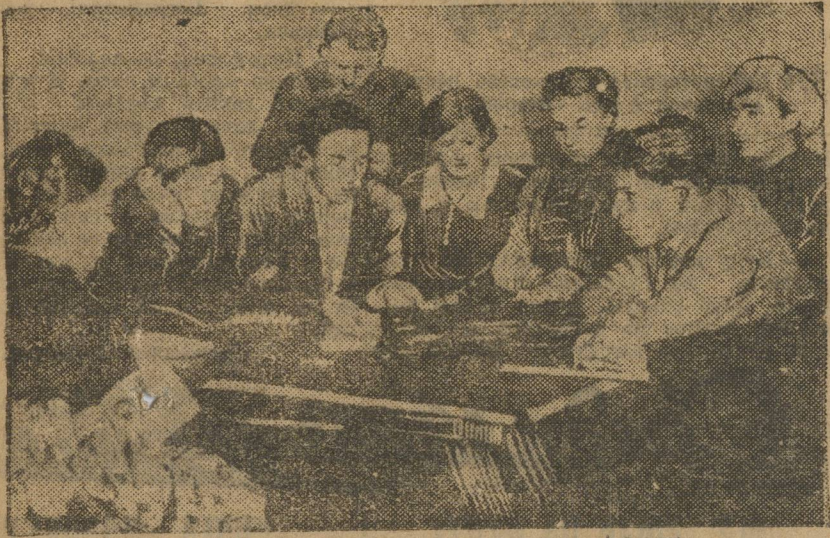
Кружок повышенного типа литгруппы «На Смену».