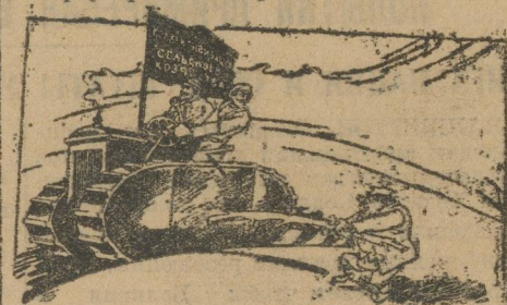
КУЛАК:—Вот чортова машина!.. Никан палку в колесо не вставишь!..

Качество всячески мешает разрыванию социалистического переустройства деревни.