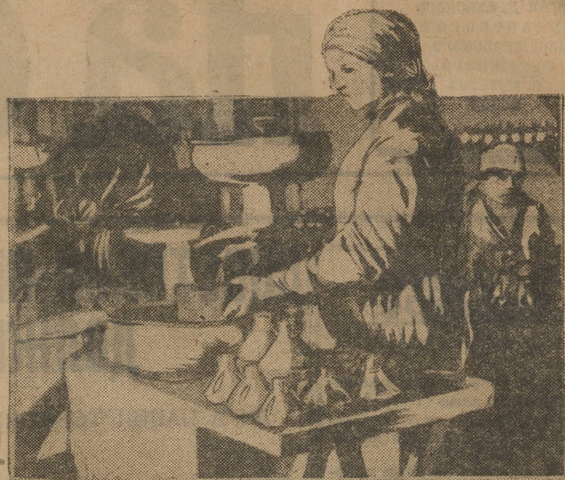
Испытание на регулировку волчков в молочной лаборатории.