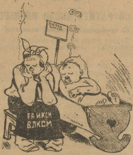
Спите орлы боевые...

В Баженовском районе большинство ячеек ВЛКСМ (Кочневская, Бруснянская, Измоденевская, Хромцовская, Со-