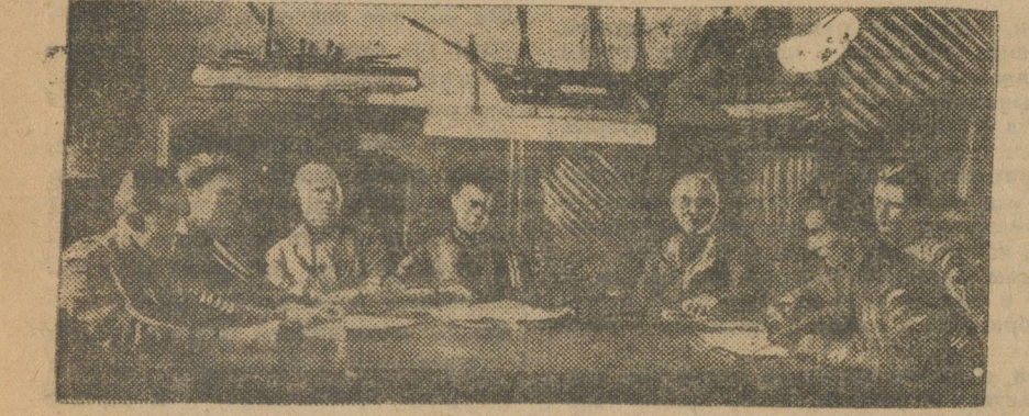
Недавно исполнилось десятилетие военной Академии РККА им. Фрунзе. На снимке—студенты Академии в военно-морском кабинете.

К этому времени кружок имеет крепко сколоченный актив в 40 человек, имеет хорошо оборудованный уголок, при котором развернута массовая военная работа.