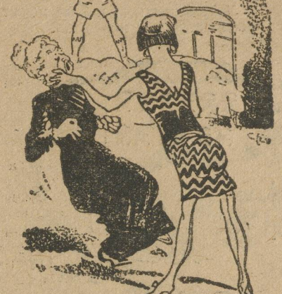
Трудно было понять, что происходило в комнате.

— В „Над Курюю“. Духан козацкий, казавский духан князя Карачаева.