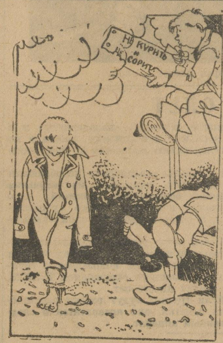
Понятно без слов.

которая у ребят пользуется большой популярностью.