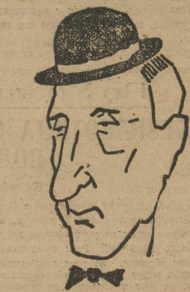
«Рабочий вождь» СИТРИН (Англия).

На Афганистана сообщает, что восстание разрастается. Повстанцы хорошо снабжены английским оружием. Правительство приняло решительные меры к подавлению редакторского восстания.