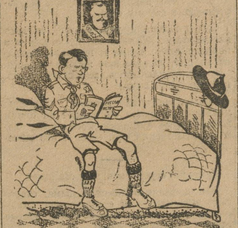
Юноша держал в руках истрепанную книгу и расквашиваясь читал...

Улица состояла из гостиных. Из окна номера в отеле «Тристан» было видно напротив совершенно такое же окно отеля «Мессина». И номер в отеле «Тристан», вероятно, совершенно ничем не отличался от номера отеля «Мессина». Такой же камин с зеркалом над ним и такие же обои с пестрыми, несуществующими в природе цветами и железные ставни со щелчками-просветами. Но все же в обстановке этого номера отеле «Тристан» было кое-что, удивившее Мерца и Митина: очень большой образ и лампада в одном углу и портрет Александра третьего в другом. На широкой пышной кровати сидел юноша в костюме бойскаута, в коротких штанах, с грязно-желтым галстуком на шее. Юноша держал в руках истрепанную книгу и, расквашиваясь, как мальчик, читал вслух: