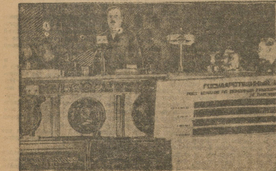
В декабре в Москве открылась 4-я сессия ЦИК СССР. На снимке пред. ЦИК тов. Чернышев открывает сессию.