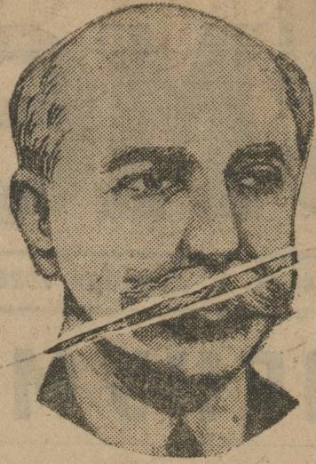
Новый румынский министр иностранных дел Миронеску, добивающийся англо-французского займа.

Перед партией поставлена задача борьбы с уклонами от ленинской линии. Эта задача имеет особое значение для Московской организации. Последние события в партийной жизни слова показали, что Московская организация как и раньше, является крепким оплотом ленинизма, верной опорой ленинской политики и партии. Примиренческие настроения к правому уклону, частично нашедшие свое отражение в организации, встретили дружный отпор и активнейшее противодействие партийных масс. Московская организация показала еще раз свою большевистскую закалку и непримиримое отношение ко всяким уклонам от большевистской линии. Мы с полным основанием можем заявить, что Московская организация была, есть и будет впрямь непоколебимой опорой ленинской политики партии. (Продолжительно и шумные аплодисменты).