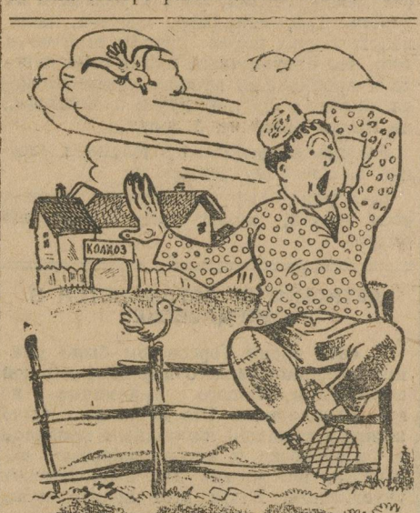
«Наше дело — сторона».

В 1926 г. коммуна сливается с артелью «Мукмом» и с этих пор коммуна начала быстро развиваться. Сейчас ком-