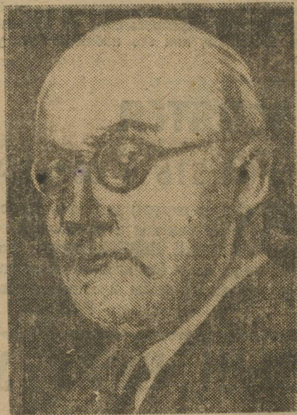
ГЕРБЕРТ ФОН-ДИРКСЕН, назначенный на пост германского посла в СССР.

Доньше к протоколу присоединилось 40 государств, включая все великие державы. Ратифицирован протокол пока только СССР, Франция, Италия, Австрия, Венгрия, Эстония и Либерея.