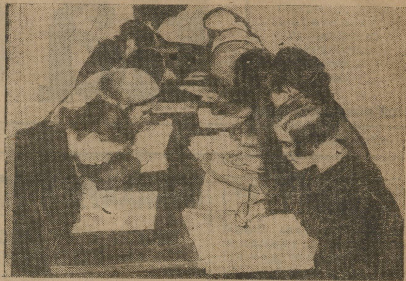
Занятия на ликпункте Ленинской фабрики (в Свердловске).

На будущее время необходимо со стороны райкомов чаще созывать совещания депутатов-комсомольцев (за все время моей работы, нас заслушали по одному разу горсовет и горкомзл) и давать практические указания в работе. Для более продуктивной работы лучше всего комсомольцев прикреплять к одной секции, а не перебрасывать их из секции в секцию, как это наблюдалось у нас.