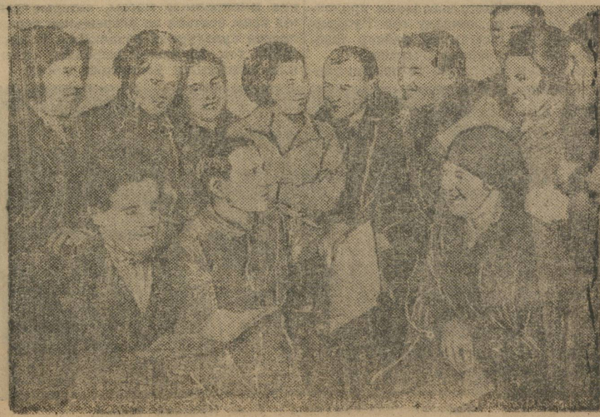
ГОТОВЯТСЯ К ПРЕНИЯМ.