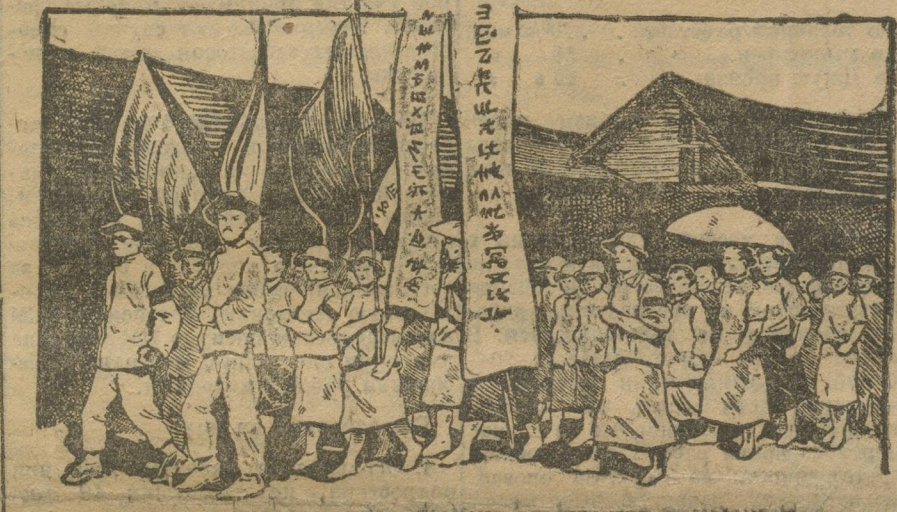
ДЕМОНСТРАЦИЯ КИТАЙСКИХ СТУДЕНТОВ В ШАНХАЕ.

На состоявшемся массовом митинге участвовали тысячи женщин, рабочих, студентов и представителей всех слоев населения. Выступавшие женщины ораторы подчеркивают, что национальная революция и возникшее одновременно с нею женское движение открывают новый мир китайской женщине. Речь ораторов встречали восторженный отклик участников митинга.