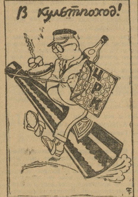
Церабкоп в культпходе собрался.

15 ноября в столовой № 5 в комнате, которая имеет 10 столов, в 4 часа дня, когда бывает наибольшее количество