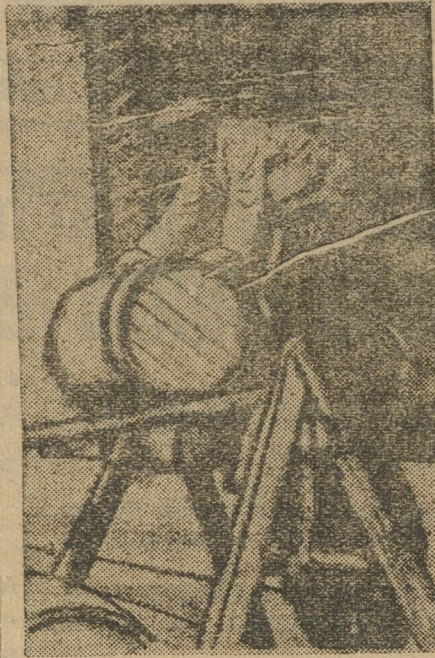
На субботнике в помощь школе. Разгружают вагоны.