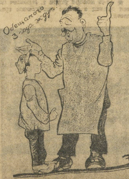
Мастер:—«Чего спешить? Лишь бы

Специалка для завышения ЛПЗ а яв- ляется веходным пунктом по топливным спорам. В колдоборах, з оазисах «Уни- ячтество» есть такой пункт, призываю «слова». «Все без иключения работ- но» (слова входят и ученики) получают спе- одежду по характеру работы. А между тем этот пункт из 80 пп. не включе- ется. Так первоначальн-ученики кинес- спортного и марширов-кого цехов гра- дятся лично не получают. Есть ряд за- регистрированных случаев «включении» тяжелых ожогов только из-за отсутствия необходимой специалки. В то же время дети-отщипники все без исключения и в целую очередь получают все необходи- мое. В чем дело? Ведь завышенности сразу steigen на восточной работ. Та- кое положение вещей в том же цен- вально.