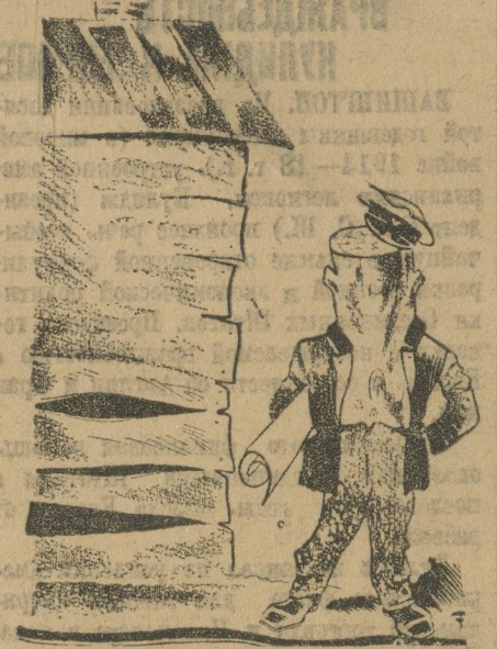
Материал для затычки щелей.

Молодежь Карабашинского завода хочет указать на недостатки своей работы. В 1927 году были выстроены дома для рабочих Карабашинского завода в станице опном поселке. Рабочие радовались новому строительству, но они потрогались, радовались. У новых домов в две-