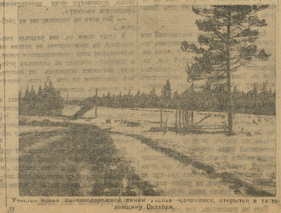
Участок новой железнодорожной линии в районе Сопки, открыт в 12 г. довшину. Октября.