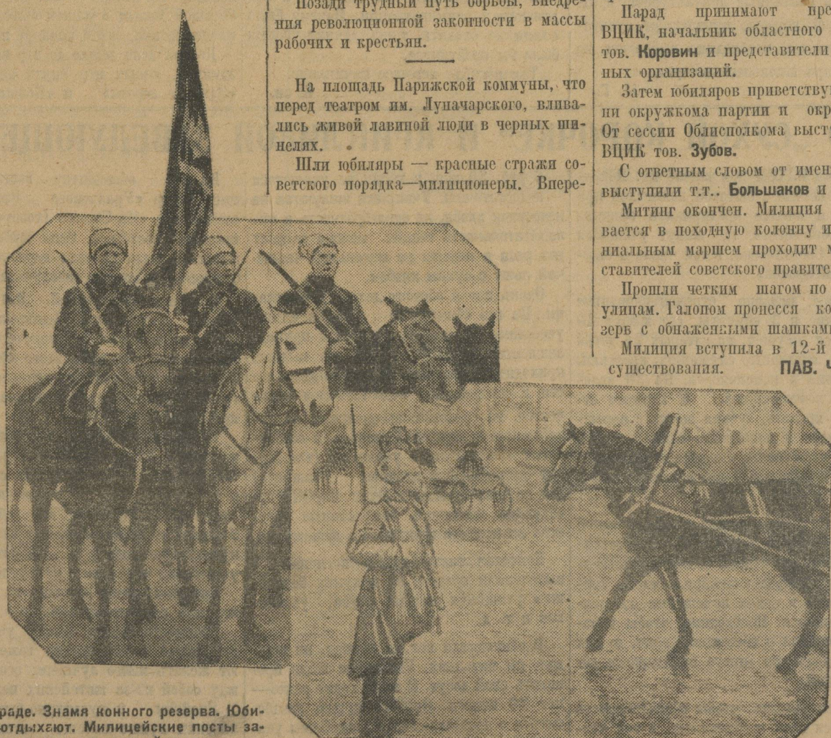
На параде. Знамя конного резерва. Юбиляры отдыхают. Милицейские посты заменены красноармейцами.

Милиция вступила в 12-й год своего существования. ПАВ. ЧИКАШ.