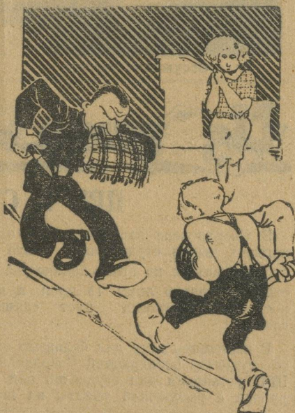
Из-за «дамы сердца».

В результате школьный вечер, который кроме источника средств, должен играть большую культурно-воспитатель-