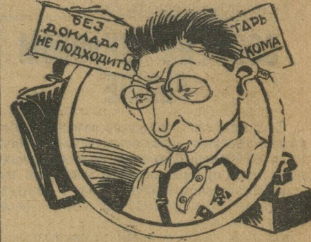
— Чем шляешься по ответственным работникам?!