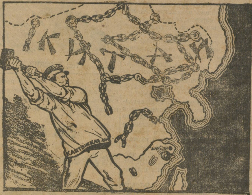
Да здравствует свободный Китай!