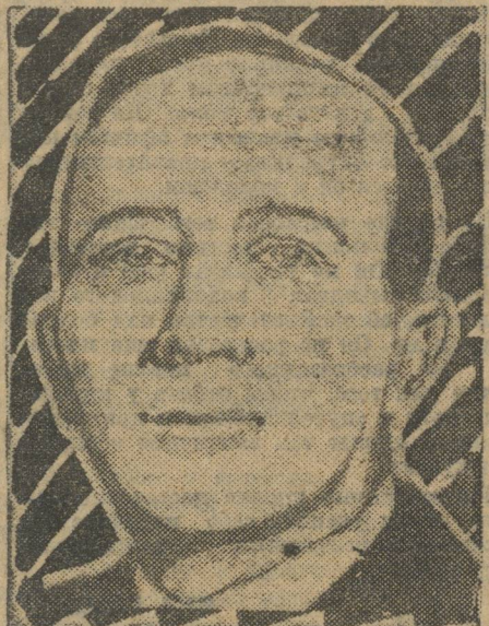
ФОСТЕР, кандидат Уоркерс Парти (коммунистической) на пост президента С.-А. С. Ш.

Впервые, после 1919 года, когда в штате Нью-Йорк был издан закон, воспрещающий «выставление и поднятие красного флага» в публичных местах, на улицах Нью-Йорка развешивались красные знамя. Демонстрация, во главе с Фостером (коммунистич. кандидат в президенты С.-А. С. Ш.), Гитлоу и другими