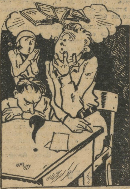
«Моление о литературе».

Некоторые школы уже начали работы, но большинство школ до сих пор на «мертвой точке». Причина та, что нет литературы: нет учебников. Всего учебников имеется 90 штук, а слушателей по одной школе около 150 человек. С руководителями тоже дело обстоит не совсем хорошо. Часть совершенно не соответствует делу руководства школой. Можно предполагать что если со стороны РК ВЛКСМ своевременно не будут приняты соответствующие меры то будет так же, как и в прошлый год: в