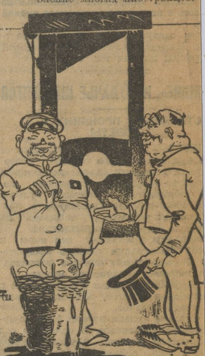
Иностранец (нанкинцу) — Искренне восхищен вашими успехами!

В Шанхае открылась выставка изделий китайской промышленности. Китайские изделия того же типа и сложности, что и европейские, не уступают иностранным, что вызвало удивление многих иностранцев.