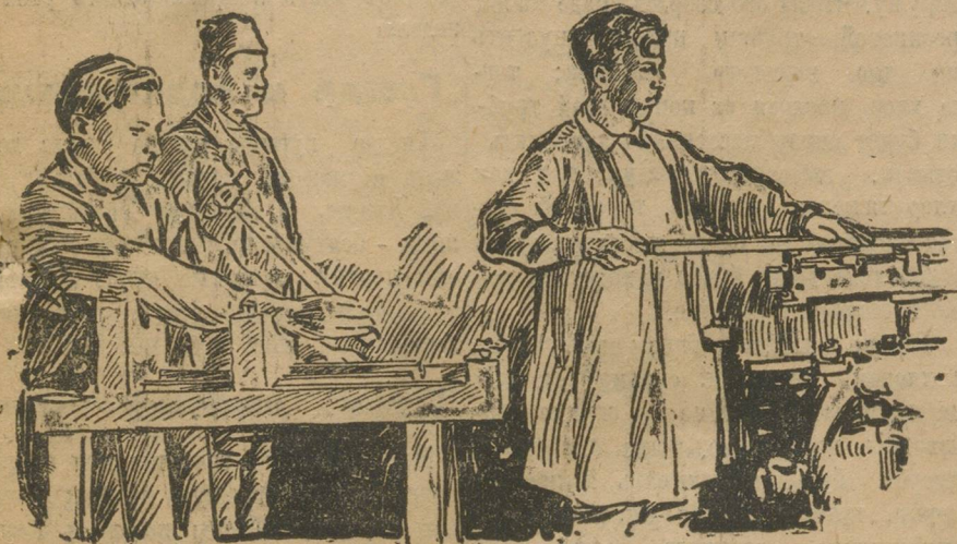
РАБОТА ПО МЕТОДУ ЦИТ'а В ШКОЛЕ ФЗУ «МОНЕТНИ».

Метод ЦИТ'а может и должен быть применен во всех механических школах ФЗУ, в профтехшколах