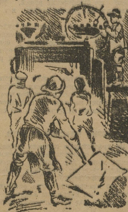
Ударники за работой.

С полным сознанием своей ответственности перед заводом эти производственники-технические специалисты ждут от них отчета о своей работе. Но главная беда у этих бригадников заключается