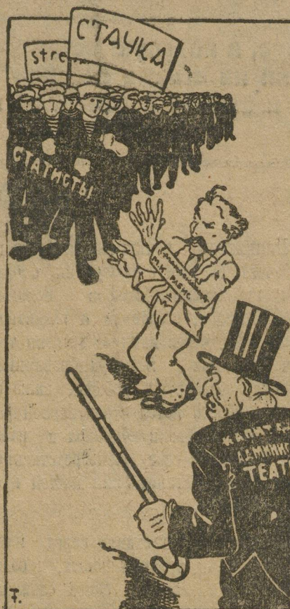
«Политкартинатура» в городском отделе.

Через два-три дня после открытия сезона тройка предъявила администрации целый ряд экономических требо-