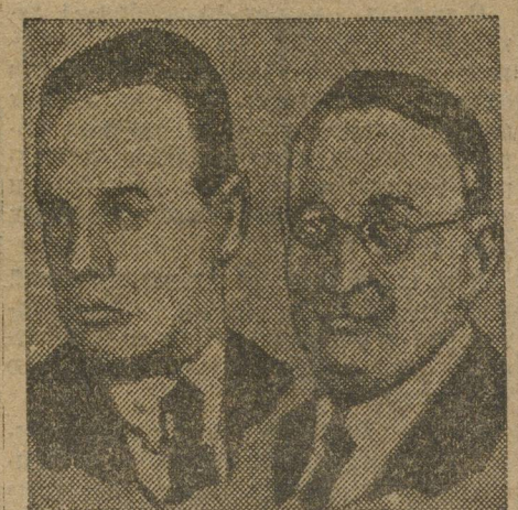
Ред. «Форвертса» ВОЛЬФАНГ ШВАРЦ. Т. КАРЛ ШУЛЬЦ, член ландтага, коммунист.

В другом текстильном центре, Озкове, демонстранты двинулись к зданию муниципалитета. Муниципальные власти вызвали полицию, набросившуюся на демонстрантов. Рабочие активно сопротивлялись. Ранено 10 рабочих и семь полицейских.