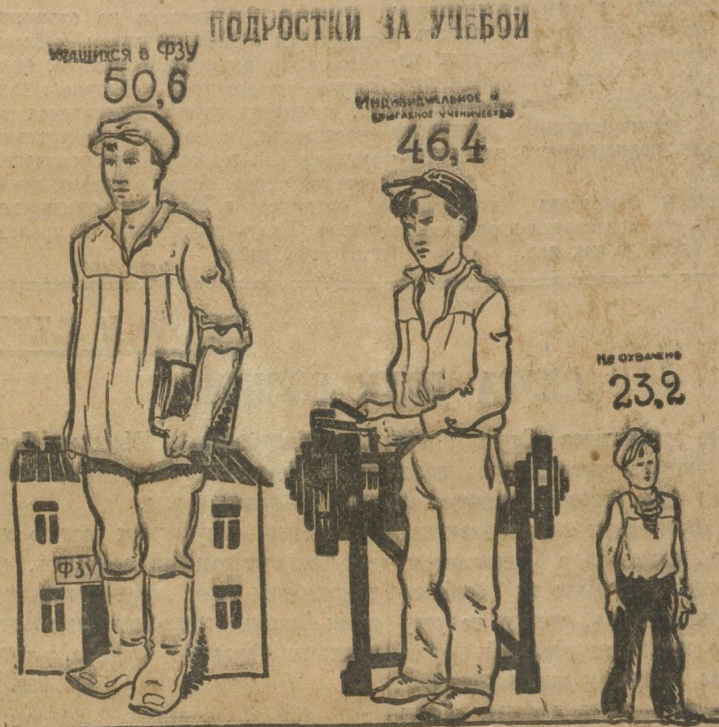
Школами ФЗУ охвачено 50.600 человек; индивидуальным и бригадным обучением 46.400. Не охвачено учебной 23.200 человек.

Первый этап пройден. За 10 лет сделано не мало — достигнута есть и достигнута не маленькая. Но еще