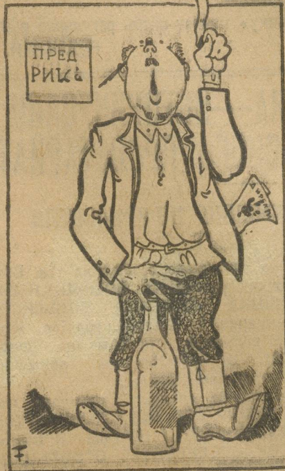
— «Препарить продажу сего» — политически невыгодно...

14-Х эти же ячейки устраивают вечер омычки в деревней и ждут вылазки деревенских комсомольцев к себе, на завод. При выезде оказана была,