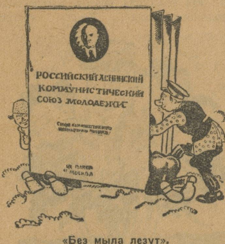
«Без мыла лезут».

ленской, Крымской и других организаций. Повидимому, такое мероприятие придется провести по всей деревенской части союза.