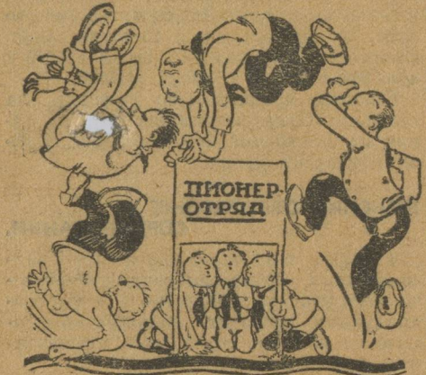
Новая игра в Березове.

Плохо обращают внимание на пионеров партийные и комсомольские организации. Например: недавно утвердил кварталный план работы президиум областной яч. ВКП, собрание оказалось в план работы внести пункт о митингах, мотивируя тем, что это—дело комсомольской ячейки, так как это ее работа. А у комсомольской ячейки (проезд в деревенной) о пионерах в плане работы тоже ничего нет.