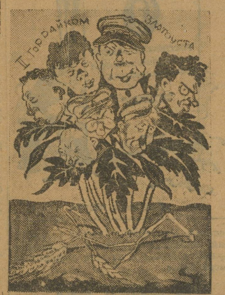
Сорную траву — из поля вон!

«Кумовство», «спайка», — вот лозунги, под которыми работало новое бюро. Все, кто выступал против — назывались «оппозиционерами»... Всегда состав