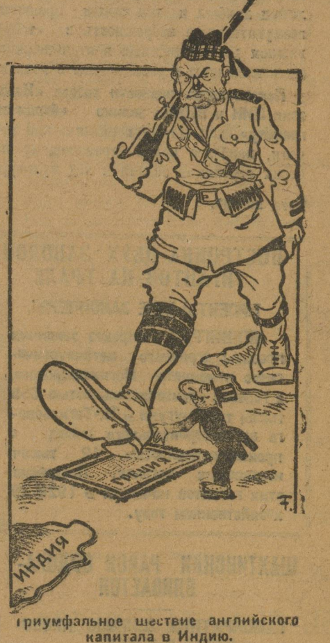
Триумфальное шествие английского капитала в Индию.

По просьбе английского правительства греческое правительство разрешило постройку нескольких аэродромов на территории Греции для воздушной линии Англия—Индия.