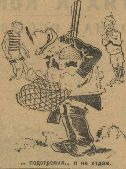
... подстрелил... и не отдам.

И волынка тишина. Физкультурники обратились в культурный отдел Уралпрофсовета, Горсовет и ряд других организаций, но никто не желает помочь им. Все просьбы остались «гласом вопиющего в пустыне».