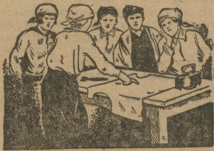
Девчата на кружке кройки и шитья.