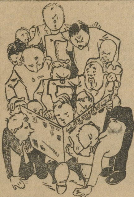
Сорок и одна.