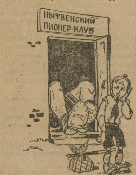
Просто и выразительно...

Руководители в большинстве своем молодые комсомольцы, с пионерской работой знакомы недостаточно. Политический и общеобразовательный уровень