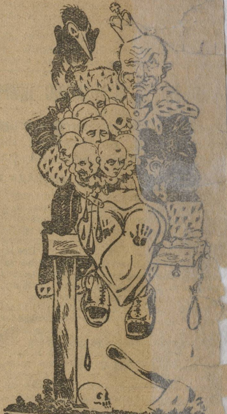
— Десятилетие царствования короля Бориса.

В Болгарии празднуется десятилетие царствования короля Бориса