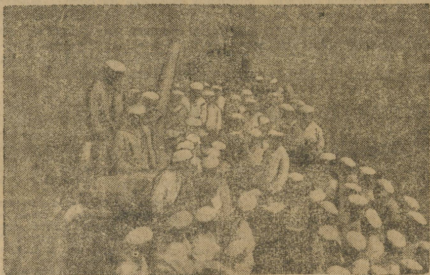
Накануне похода. Собрание команды на полубака.