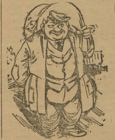
Тот, кто остается в выигрыше от неурядиц на хлебозаготовительном фронте.

Такое же положение отмечено в Сарапульском округе (Куединский и Караулинский ф-ны).