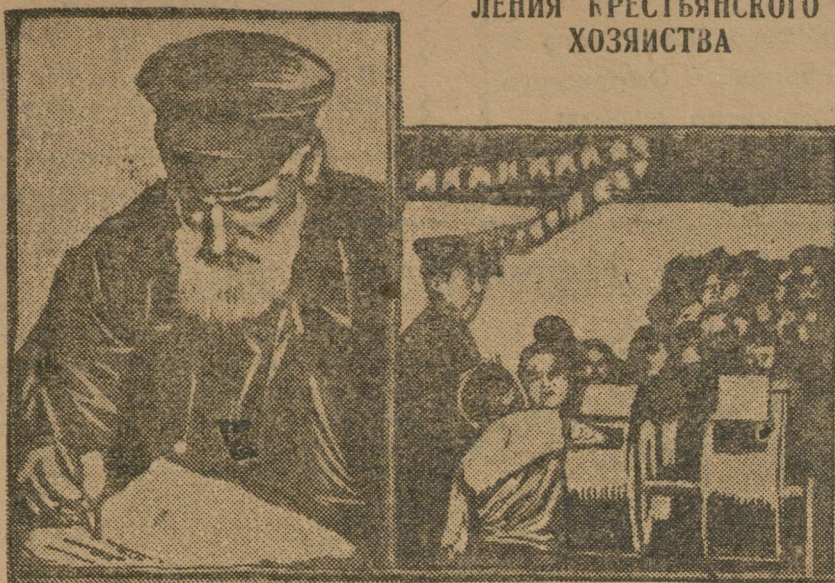
Крестьянин член тиражной комиссии подписывает таблицу выигрышей. Октябрята вытаскивают из урн номера.