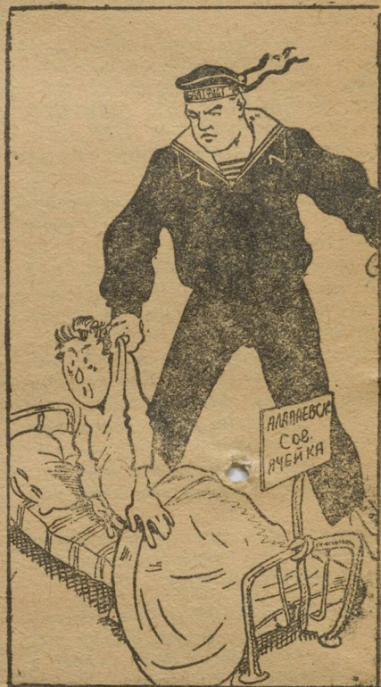
ПОДШЕФНЫЙ: — Не пора-ль, братишечка, проснуться!

Вы пишете, что работа у вас в связи с летом упала. Культработы нет, на собрания ходят 40% комсомольцев».