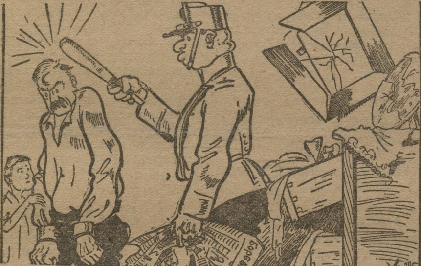
... К ГАЗЕТЕ «БОРЬБА»...

Югославская полиция произвела обыски у подписчиков рабоче-крестьянской газеты «Борьба», причем полицейские агенты угрожали им расстрелом, если они не прекратят подписку на газету.