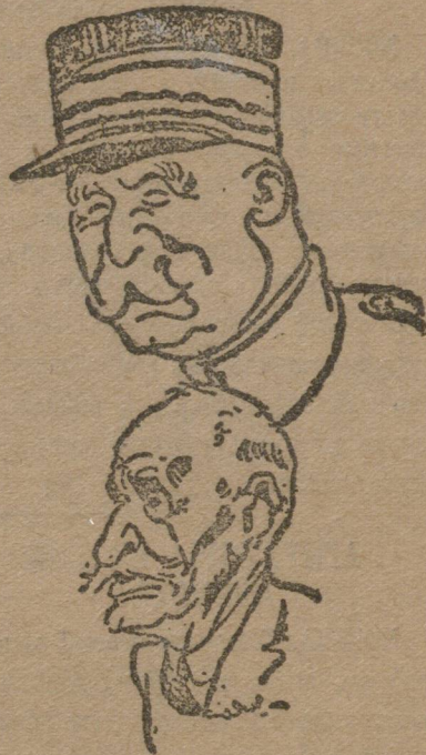
Поджигатели мира—вожди французской военной маршалы: Петен (вверху) и Фош (внизу).