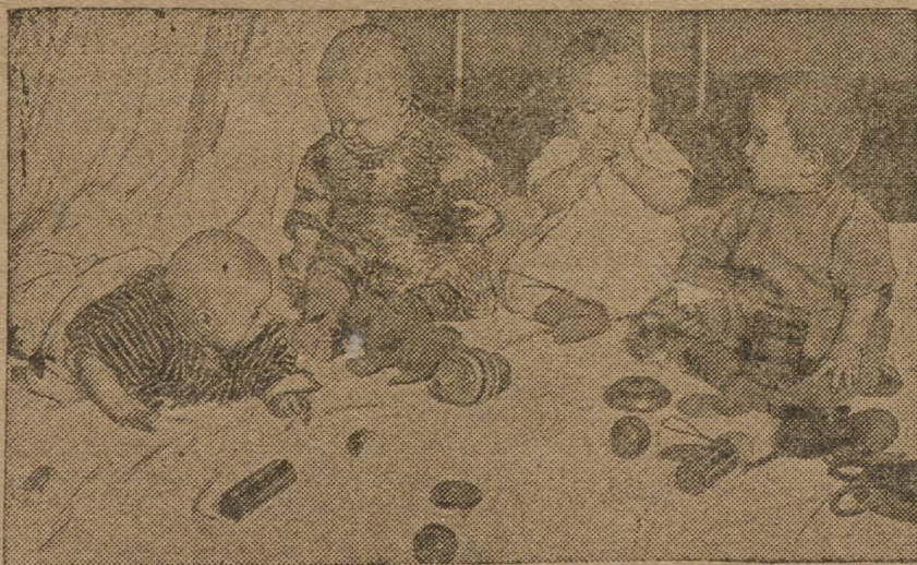
В ДЕТСКИХ ЯСЛЯХ В СВЕРДЛОВСКЕ.