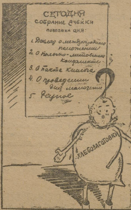
Хлеб: когда же меня поставят на повестку дня?