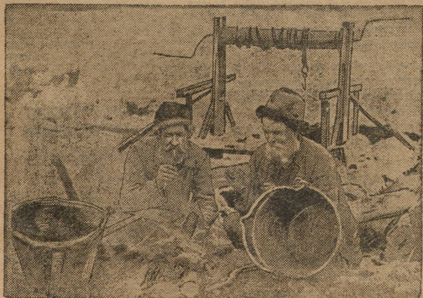
СТАРАТЕЛИ ОТДЫХАЮТ У ШАХТЫ.