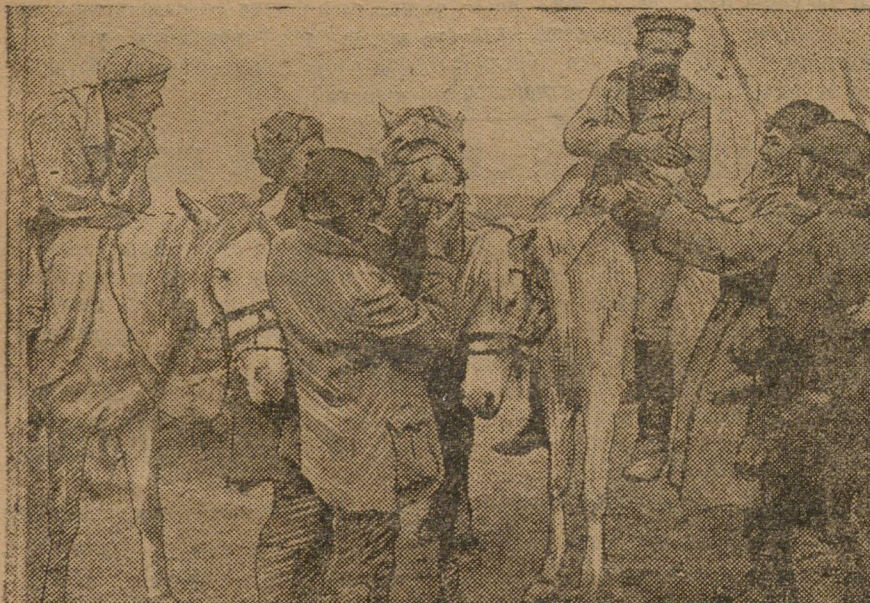
На искгисм базаре в Свердловске.

развертывается широкая сеть профтехучебных курсов, кружков и т. д.