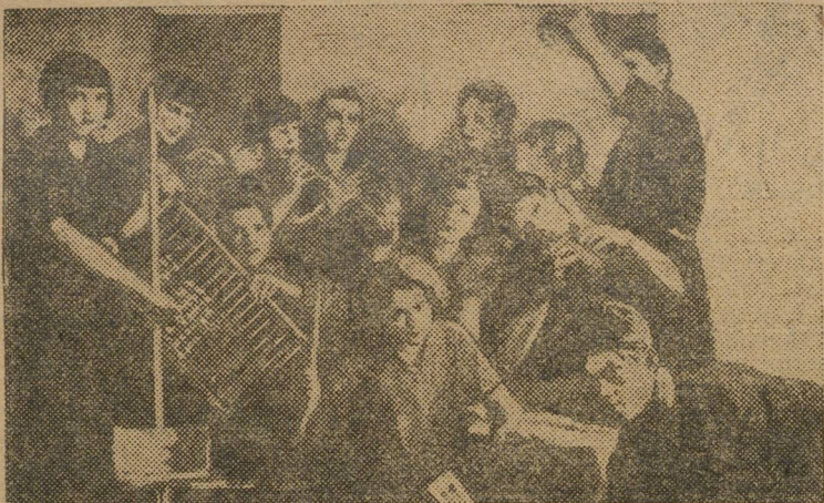
Шумовой оркестр экспериментальной ЖТГ (Пермь).

Встает вопрос, откуда берется деньги содержать такую «ораву»? Вопрос очень быстро выясняется, когда вы