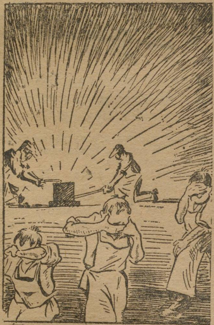
ОТ СВАРКИ «СВАРИШЬСЯ».

Вот несколько таких, сомнительной ценности, дел. Слесари последнего года обучения работают на ремонте пассажирских вагонов. Работали, как и подобает в помещении, под крышей. Но по мнению начальника мастерских крыша фабзавучникам не нужна. Бредно. Пускай дышат свежим, чистым воздухом. Ребят выбрасывают на двор. Приближается осень, зима. Дожди и снег. Хозяйственники продолжают считать, что будущим квалифицированным рабочим необходимо закалить свое здоровье и проработать год на улице, под снегом и уральскими морозами.