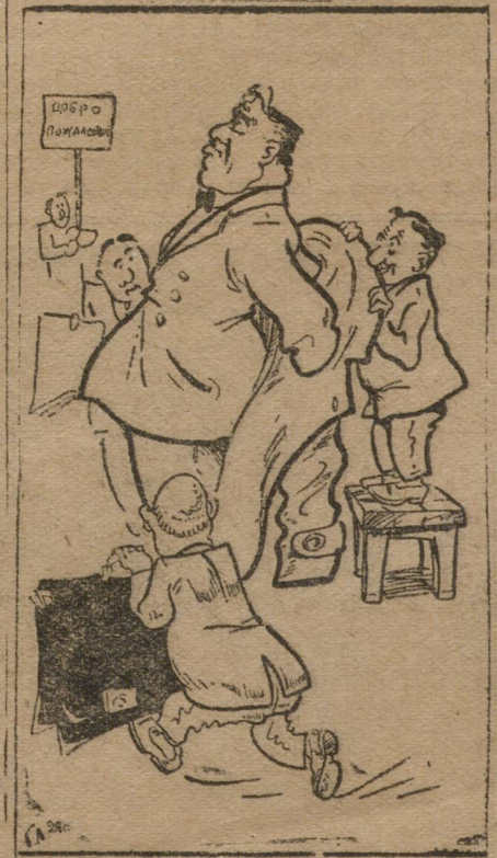
„Маленькие услуги большому человеку“.

Ячейка Уралгосторга оказалась неспособной вести борьбу с бесхозяйственностью и преступлениями в своем учреждении. Почему? Потому, что головка ячейки была в руках виновников всего дела, а низовой слой был запуган, забит.