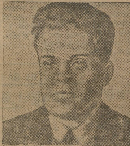
Тов. ГОЛЬМБЕРГ секретарь ЦК КСМ Швеции.

На конгрессе присутствуют 138 делегатов с решающим и 95 с совещательным голосом.