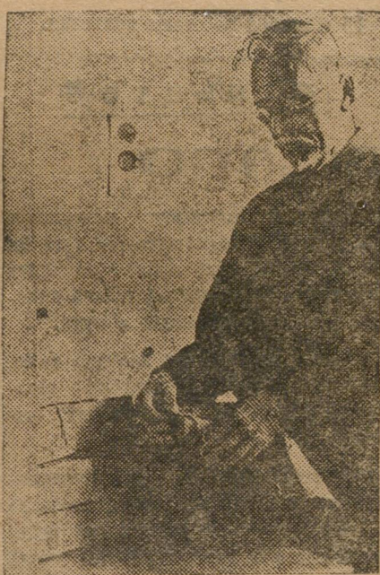
В Облфинотделе упаковывают облигации для рассылки в округа.