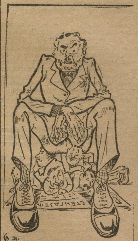
„Зажима не было. Была атмосфера скромности“.