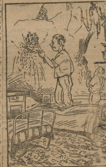
Борьба с тараканами по новейшим методам.