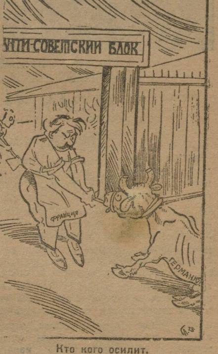
Кто кого осилит.

— Бриан прилагает усилия к вовлечению Германии в антисоветский блок. — Германия добивается очищения Рейнской области от войск союзников.