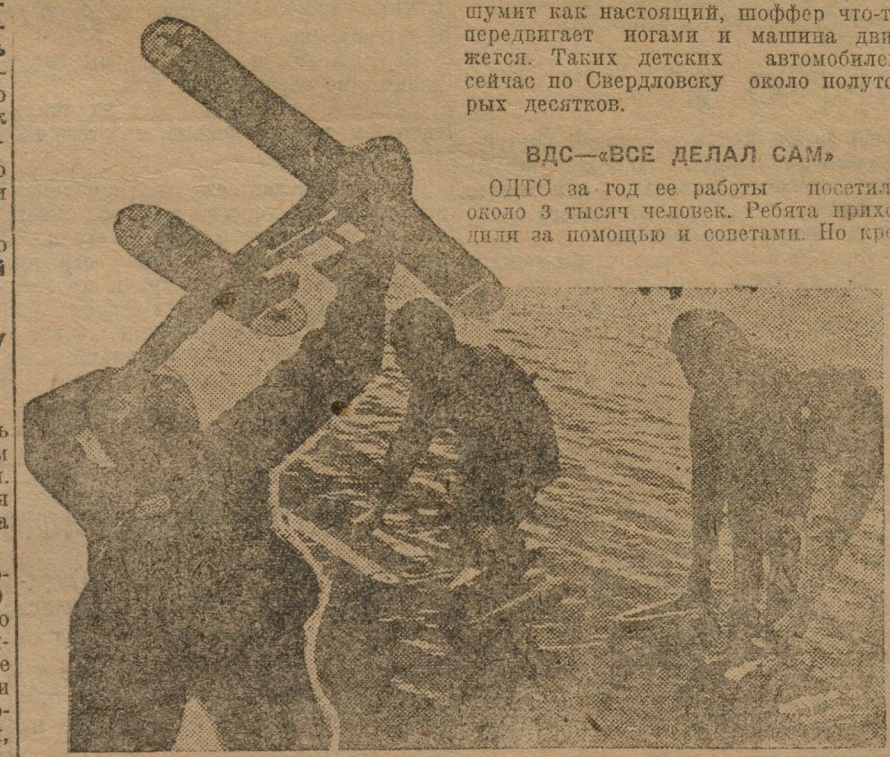
Молодые изобретатели демонстрируют свои достижения. На конкурсе планеристов.