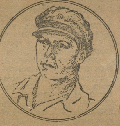
Тов. ЮРР—делегат КСМ Германии.

МОСКВА, 13 сентября весь день на конгрессе КИМ'а продолжалась работа комиссией и секций делегаций.