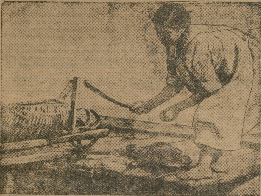
На городском пруду. За отиркой белья.