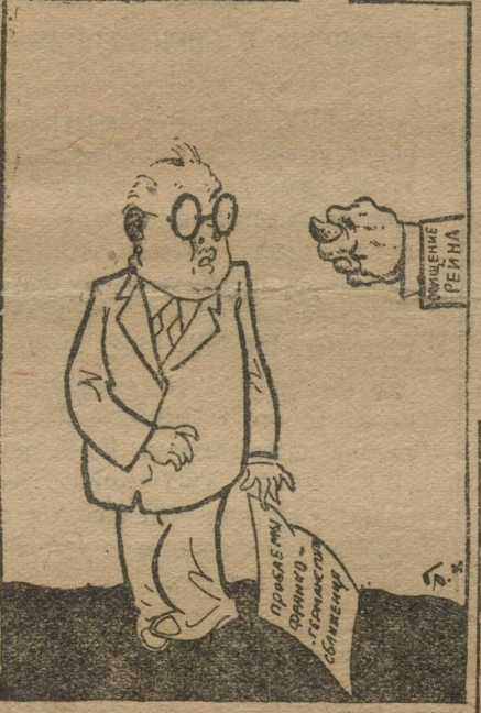
НАГЛЯДНОЕ ИЗОБРАЖЕНИЕ РЕЧИ БРИАНА.

В политических кругах речь называли «холодным душем для германской делегации» и видят в ней окончательное доказательство того, что теперешние переговоры о прекращении оккупации Рейнской области не приведут ни к каким результатам. По общему мнению, в лучшем случае Мюллер получит обещание в ближайшие месяцы начать переговоры о прекращении оккупации на основе определенных компенсаций.