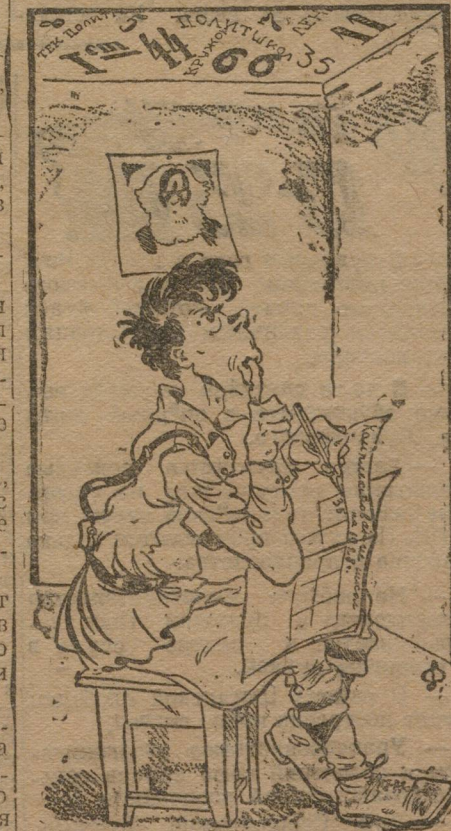
Он комплектует сеть...

Из восьми районов Свердловского округа в прошлом году именно из-за