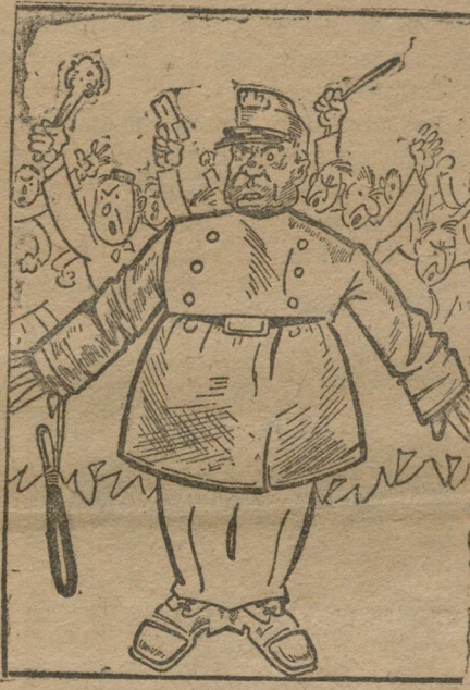
«Храбрые сыны» из-за жандармской спины.