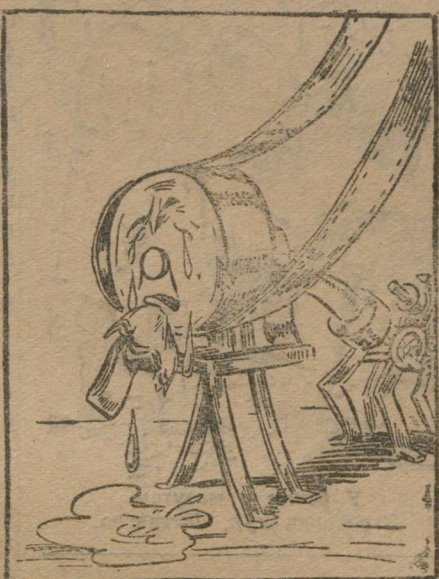
Плачут заграничные станки «Уралсепаратора».

стей. Рабочие их не сдают на склад, говоря, что иной раз нет на складе нужной части—болта, гайки, крана, пружины и т. д., вот и ищут в ящиках—нет ли там. Это значит, что мастера дав рабочему слесарю работу и отдав ему новую часть, о старой не думают. А почему бы ез-