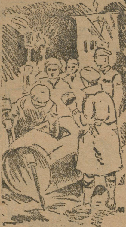
У бочки с мазутом. Зарисовка худ. Фомичева.

Нарахует в сторону неудачливый автобус. Комсомол идет.