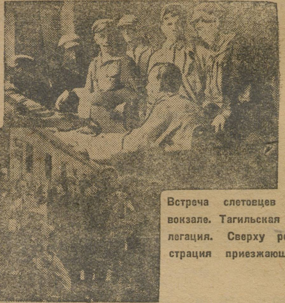
Встреча слетовцев на вокзале. Тагильская делегация. Сверху регистрация приезжающих.

Ехали отовсюду. Утром приехали челябинцы—150 чел., тагильцы—180, севьянцы—160 и т. д. Сегодня к утру из Челябинска и Тагила должны приехать еще 350 чел. Вчера вечером прибыли слетовцы почти из всех округов области. Точного подсчета прибывших еще нет, но эта цифра будет составлять около 2.500 человек.