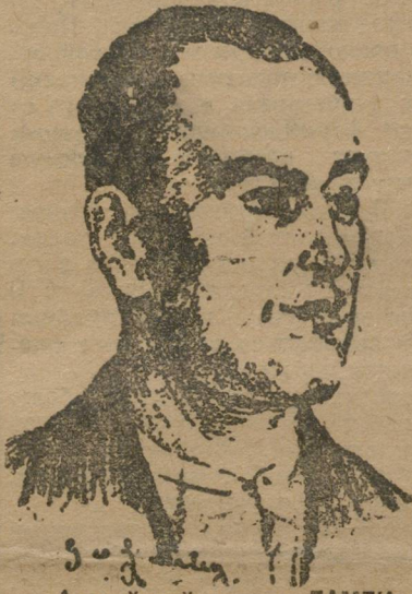
Английский делегат ЛАМЛИ.

низациях, требовать помощи и поддержки. На фронте детского коммунистического движения мы имеем ряд достижений. У нас создано теперь Центральное Бюро по детскому коммунистическому движению. Комсомол, в особенности партия, уделяют недостаточное внимание детскому коммунистическому движению. Методы работы по-