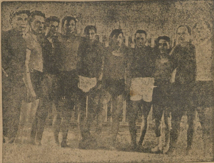
Французские баскетболисты со свердловскими физкультурниками в клубе ИМ.