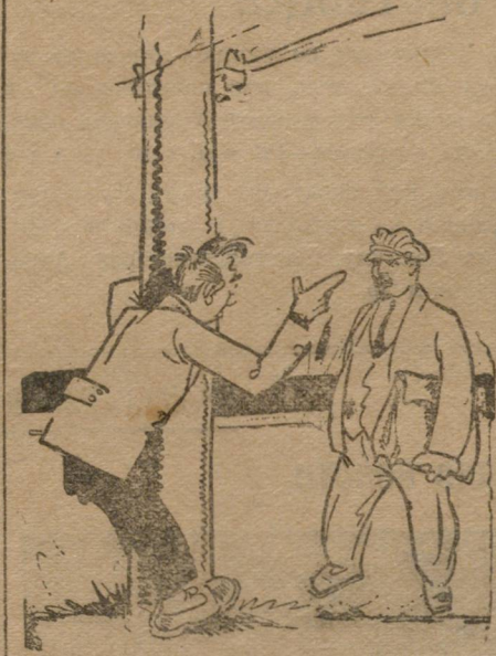
Самокритика с точки зрения... телеграфного столба.

Прошло 1½ месяца после пленума, но к сожалению, положение организации не улучшилось. Не помогли горячие фразы, пыльные речи, гастрольная поездка представителя Округкома,