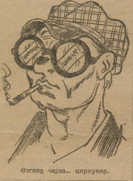
Взгляд через... циркуляр.

Не случайно майкорцы покажут вам протокол единственного пленума районного комитета, в котором с точностью до одной сотой нашли преломление директивы 8-го комсомольского съезда.