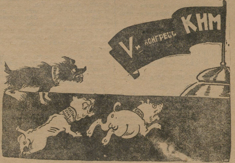
С ЦЕПИ СОРВАЛИСЬ.

Заграничные юношеские организации—противники КИМ'а в связи с V конгрессом КИМ'а и предстоящим XIV МЮД'ом, повели бешеную кампанию против Коминтерна Молодежи.