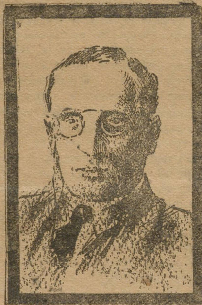
Старый большевик, председатель Петроградской ЧК, убитый 30 сентября 1918 г. эс-эром Канегисером.