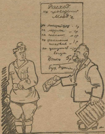
Фабном решил «разориться».

Необходимо немедленно заставить ФЗК и парт'ячку расшаркаться и принять участие в подготовке к МЮД'у. Время не терпит. Молодежь «Монетки» должна получить помощь со стороны соответствующих организаций. К. ФИЛ.