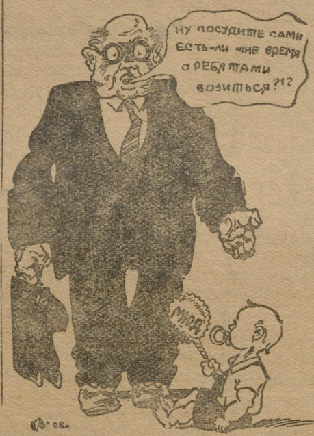
МЮД в представлении некоторых работников.

МЮД'овский призыв идет недопустимо плохо. В ячейке Машинстрой заявили обследователю, что призыва в комсомол и передачи в партию нет и не будет к МЮД'у. На кирпичном заводе выдано «в пространство» 6 анкет.