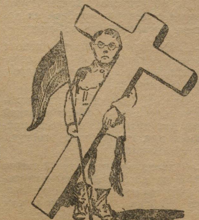
Лицо католического союза молодежи (из «Роте Фане»).

Борьба с «левыми» с.-д. союзами, разоблачение их сущности,—первейшая задача комсомола.