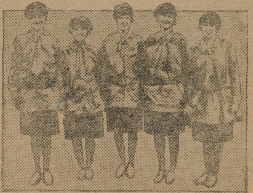
Группа членов женской рабочей лиги Красных фронтовиков, которая носит название «Английская Красная армия».