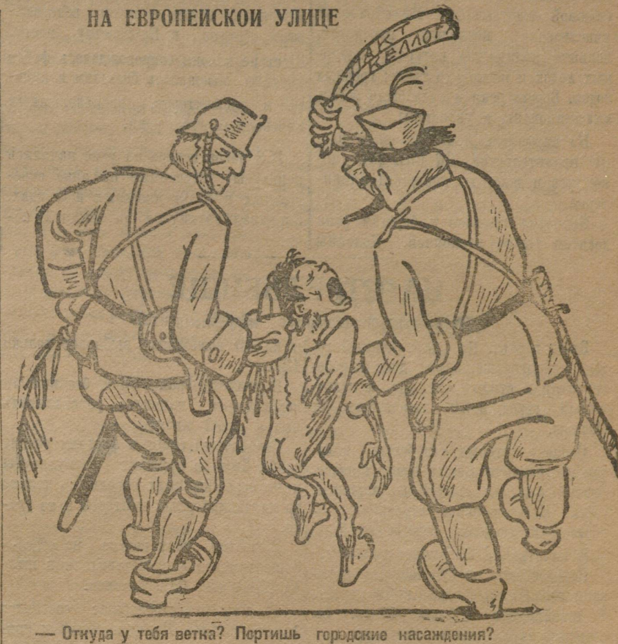
— Откуда у тебя ветка? Портишь городские насаждения?

АФИНЫ. Компартия Греции действительно проводит кампанию, связанную с предстоящими парламентскими выборами. Во всех избирательных округах выставлены кандидаты блока единого фронта рабочих и крестьян. Кампания блока пользуется значительным успехом в массах, однако, блоку едва-ли удастся провести в парламент больше трех депутатов, ибо новый избирательный закон обеспечивает победу буржуазных партий.