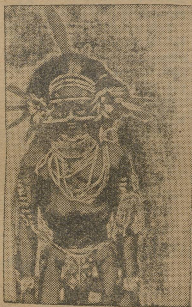
Папуасский модник с осинной талией и головой дикобраза.