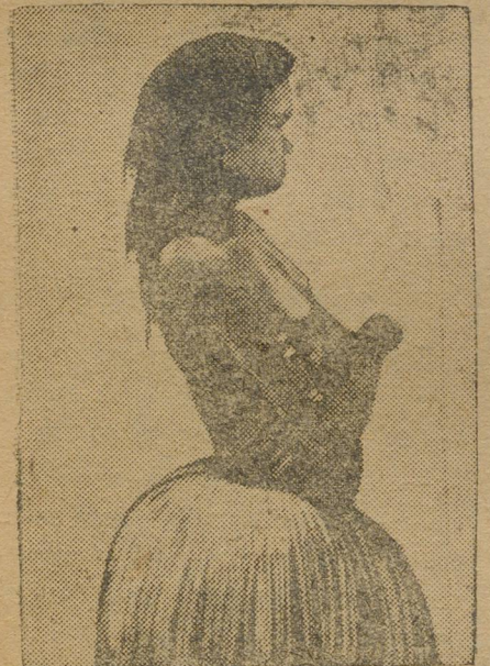
Туземная красавица в «элегантной» юбке из тростника.

Новая Гвинея—это второй по величине остров на земле. Он богат углем, золотом, нужными тропическими растениями и является родиной населения, численностью до полутора мил-