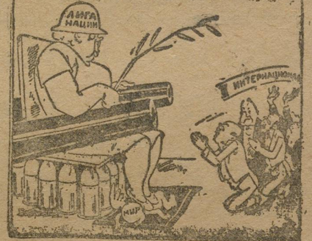
К своему хозяину.

БРЮССЕЛЬ. На заключительном заседании Брюссельского конгресса Вандервельде почти при пустом зале огласил доклад политической комиссии и