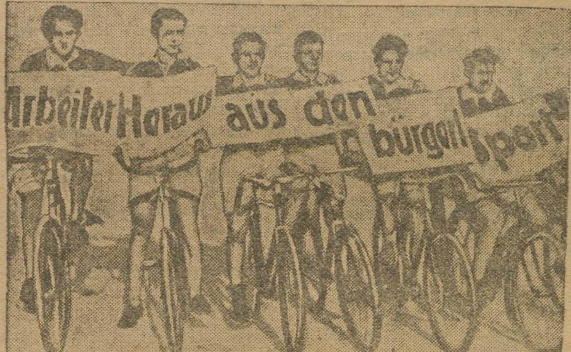
Немецкие спортсмены-велосипедисты. На плакате лозунг: «Рабочие, выходи из буржуазных спорторганизаций».