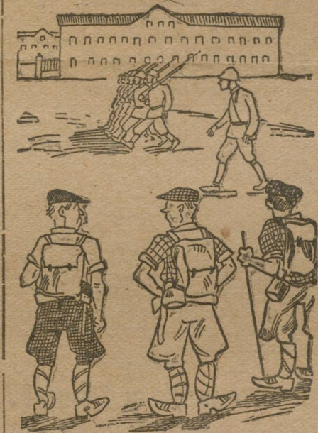
Занимательная и веселая обязанность.

БОЛЬШИЕ АФИШИ НА ДВУХ ЦЕНТРАЛЬНЫХ УЛИЦАХ ДОБРЯНСКОГО ЗАВОДА. ГОРЯЧИЕ РЕЧИ КОМСОМОЛЬСКОГО АКТИВА ОБ ЭКСКУРСИИ В ПЕРМЬ. ВЗБУДОРЖИЛИ ЧУТЬ НЕ ВСЮ РАБОЧУЮ МОЛОДЕЖЬ.