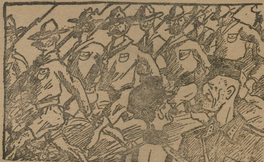
— Немного угрюмый вид у ваших бой-скаутов. — Нет. Они просто забыли побриться.

Английский ген. Верт посетил Ревель (Эстония) для совещания с состоявшим эстонских бой-скаутов.