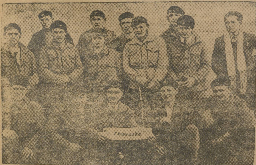
Группа молодых рабочих фронтонеров г. Першинга.