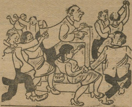
Так сказать «оживление».

Открыли. Откуда только комса явилась—понаперли со всех сторон. Открыли собрание. В прениях—ничего.