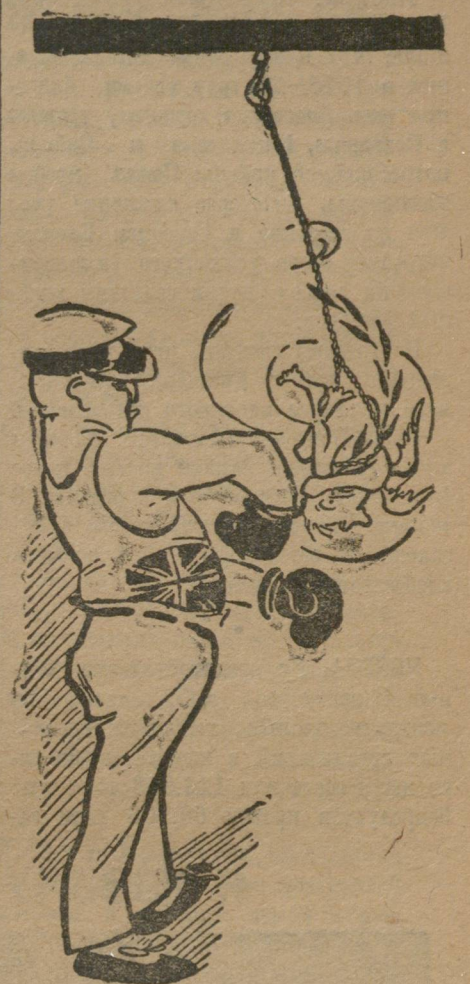
Перед подписанием договора о запрещении войны.