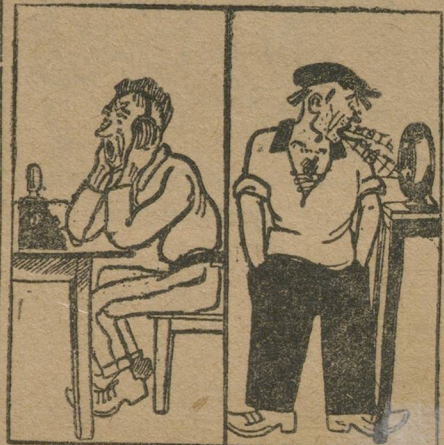
Наиболее «интересный» номер Свердловской радио-трансляции.

К сожалению, этот вопрос выяснять не так-то просто. Фактически хозяином свердловского радиовещания как будто бы является Свердловская телефонная станция. Она получает специальные средства на радио-вещание от Наркомпочтеля. По другой версии хозяином радио-узла является округ овязи. Хотя это учреждение и заявляет, что телефонная станция вполне са-