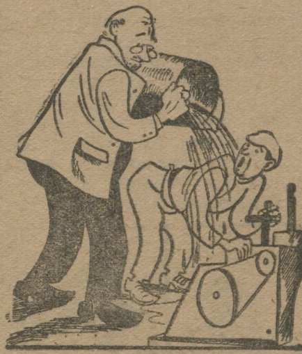
Ледяной водой бюрократического недоверия.

Швидини отдал свой проект производственной комиссии, затем проект