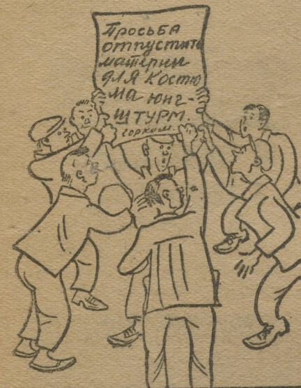
— На каждого по костюму, на десять по бумажке.

шапочную мастерскую. Но это долго не продолжалось—Райком решительно пошел на «борьбу с бюрократизмом», решил выдавать разрешения не меньше чем 10 чел. Придет в Райком комсомолец, просит бумажку, а ему отвечают—«вели еще 9 человек».