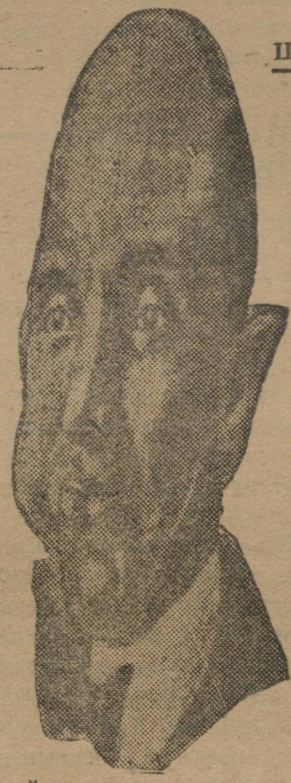
Польский министр иностранных дел Залеский.

Газета «Норанна Два Гроша» пишет: «Польша имеет двух врагов: внутренний враг, это — коммунисты, внешний — СССР, снабжающий коммунистов средствами и агитационной литературой».