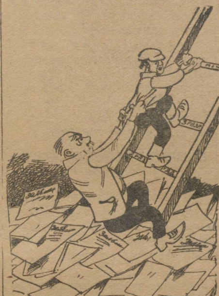
— Куда! Стой! Подождет разряд.

Если подросток работает по 1-му разряду, даже 6 месяцев, то на счет пробы все равно и говорить не стоит, ничего не добьешься.