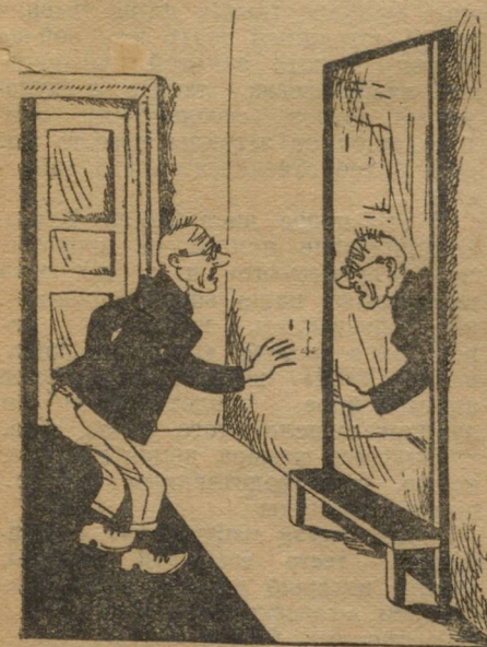
— Скоро «Уралмет» себя не узнает

Между Обкомом союза горняков и Уралметом был заключен коллективный договор. В договоре Уралмет совместно с союзом обязывался проработать вопрос о возможности организации сети школ Горпромуча на горных предприятиях Уралмета. Был установлен трехмесячный срок этой проработки.