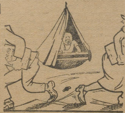
Муж на собрание, жена тоже. Что делать?