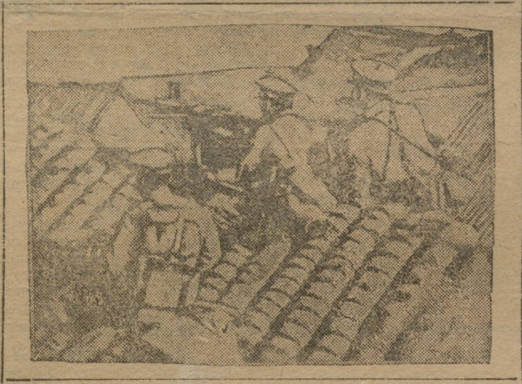
Японские пулеметчики на крышах домов в Цзинани.