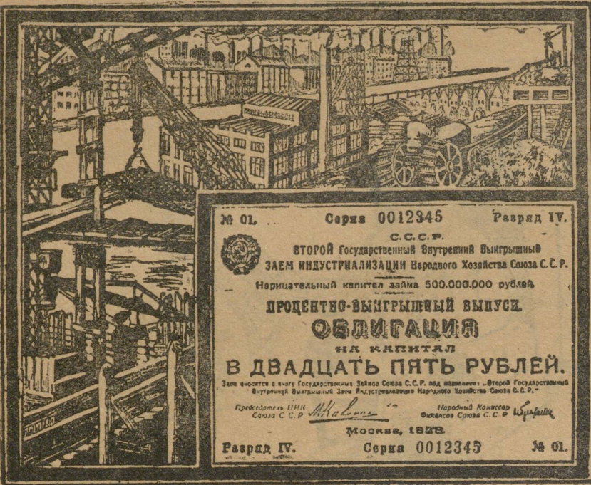
Образец облигации нового займа.

ОМСК. В ряде предприятий РАБОЧИЕ во время обеденного перерыва, УЗНАВ О ВЫПУСКЕ ВТОРОГО ЗАЙМА ИНДУСТРИАЛИЗАЦИИ ПРИВЕТСТВОВАЛИ РЕШЕНИЕ ПРАВИТЕЛЬСТВА и высказали уверенность что заем встретит поддержку среди рабочих и крестьян. ТВЕРЬ. Тверские рабочие одобряют новый заем индустриализации и высказываются на страницах тверской «Правды» за поддержку займа. Рабочие предлагают немедленно организовать подписку на заем. ВЯТКА. Сотрудники коммунального банка подписались на второй заем индустриализации в размере месячного заработка и вызвали коллективы других учреждений.