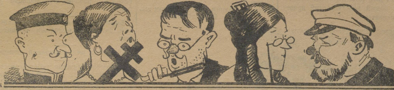
Зоологическая галерея ископаемых преподавателей педтехникума.

Тобольский педтехникум несколько лет подряд был спокоен от всяких ревизий, комиссий или инспекторов.