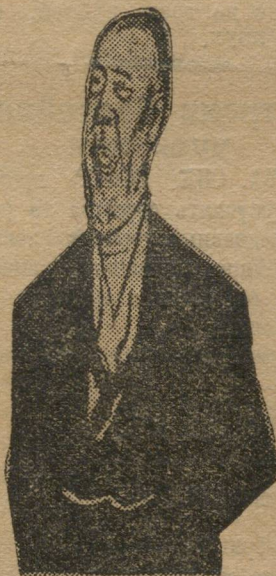
Глава японского правительства ТАНАКА.