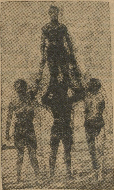
Челябинские физкультурники на водной станции УОСПС.

Военный Городок. Поднятие тяжестей с 5 час. вечера.