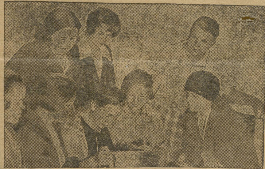
ГРУППА ДЕВУШЕК—ЧЛЕНОВ ОБКОМА.

О том, что не всегда можно полагаться на договоренность и на торжественные речи — хорошо говорит опыт