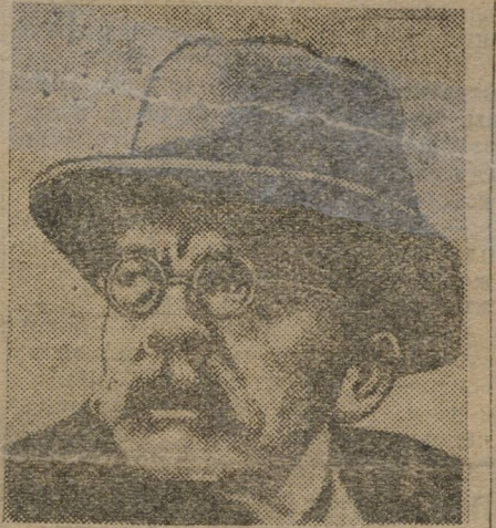
Автор «Интернационала» ПЬЕР ДЕЖНЕВ. встреченный бурной овацией на VI конгрессе Интернационала.

Как же отразилась стабилизация и связанная с ней рационализация в буржуазных странах на положении молодежи? Рационализация привела к тому, что удельный вес молодежи в промышленности в общем повысился. Поэтому секции Коминтерна должны обратить большее внимание на работу среди пролетарской молодежи. Между тем, мы часто наблюдаем среди коммунистов и работников профсоюзов