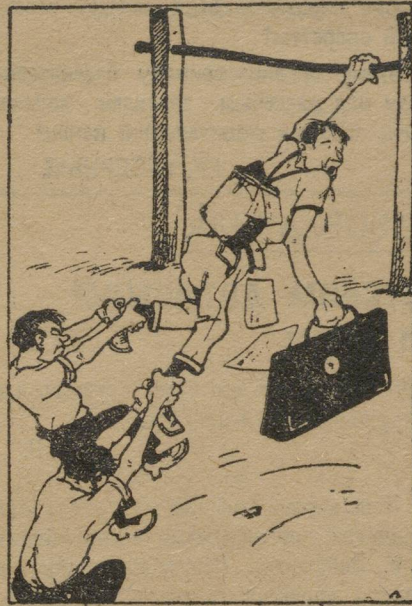
Инструктор с «нагрузкой».

ФК проводятся у нас не для всей массы ф-ков, а для определенной группы, которая за счет рядовой массы совершенствуется. Низовой-же работник ФК заброшен в деревню и в силу комсомольской дисциплины числится инструктором ФК, получает