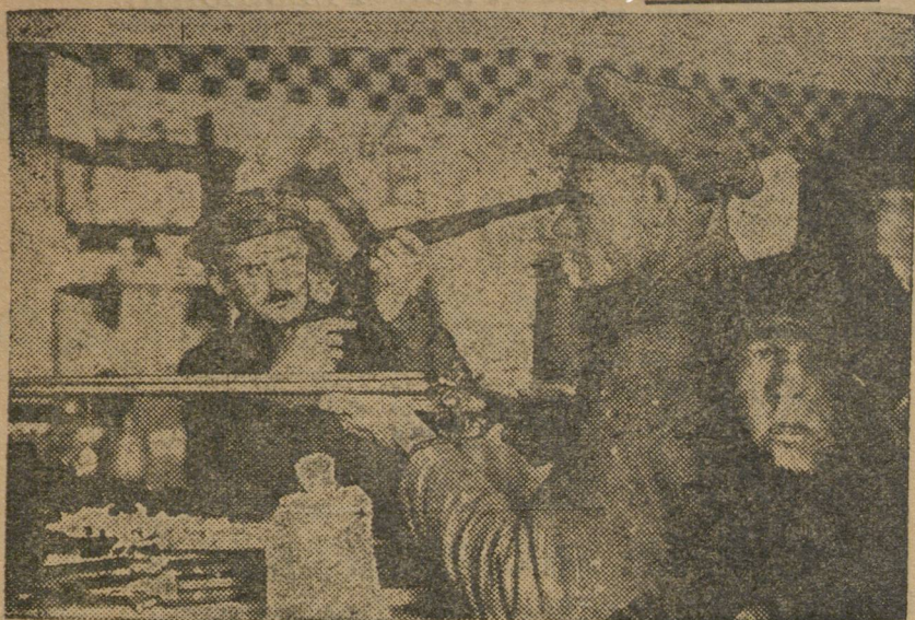
1 августа близко. Охотники готовятся...