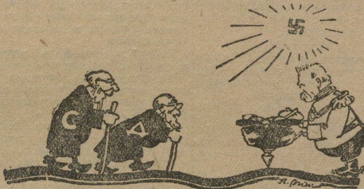
...И ИХ ПУТЕВОДНАЯ «ЗВЕЗДА».

Вновь образованное германское правительство начало с того, что выразило Гинденбургу восхищение по поводу рождения у него внука и продолжения рода Гинденбурга по мужской линии. (Из телеграмм).