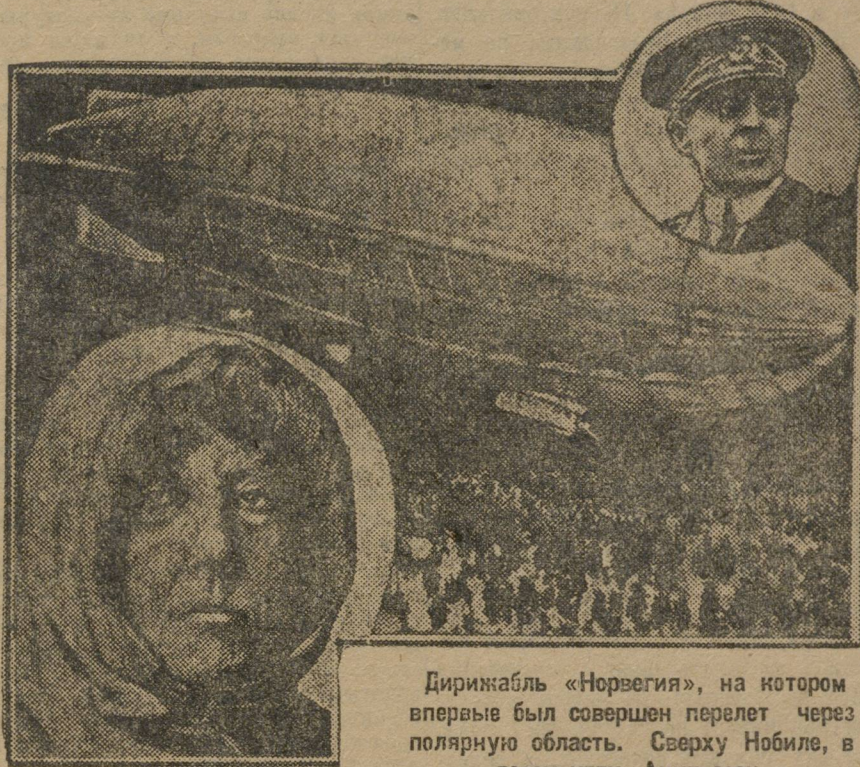
Дирижабль «Норвегия», на котором впервые был совершен перелет через полярную область. Сверху Нобиле, в левом углу Амундсен.

Последний этап в области полярных полетов—это предприятие итальянского генерала Нобиле, вылетевшего на дирижабле «Италия». В середине мая этого года Нобиле вылетел со Шпицбергена на восток через архипелаг Франца Иосифа до Сибирского полярного моря и после 69-часового путешествия благополучно возвратился обратно. Во время второй поездки, во время которой он 24 мая достиг полюса, «Италия» потерпела аварию. Дальнейшие события известны каждому из газет.