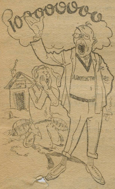
Вши? Ерунда, главное руда (!!).

Посредине нашей казармы стоит 6 лет небеленая печь, кругом ее сколоченные из досок кровати, из одного стула. На всю казарму 1 стол, поль-