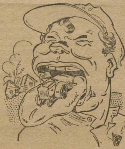
Мы вам трактор! Мы вам локомобиль! Мы вам мельницу!...

Шефячейка при Уралоблсоюзе организована три года тому назад. Но результатов ее работы не видно. Сначала, правда, у ячейки были выезды в деревню, из подшефных деревень приезжали гости. После этой начальной «горячки» работа шефячейки ослабла. Дела ячейки начали переходить от одного секретаря к другому, тихо и спокойно, перевязанные шнурком, лежали в столе. Эта мертвая спячка продолжалась около года.